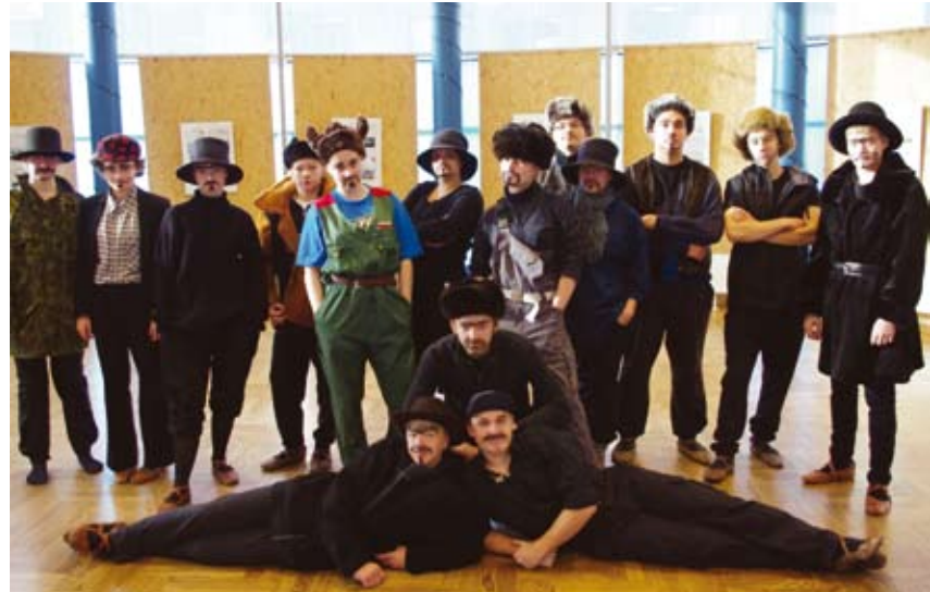
Pärandikultuuri hoidmisega on vallas tegeldud kogu aeg. Tantsurühm „Samm sassis“ mardisantidena.