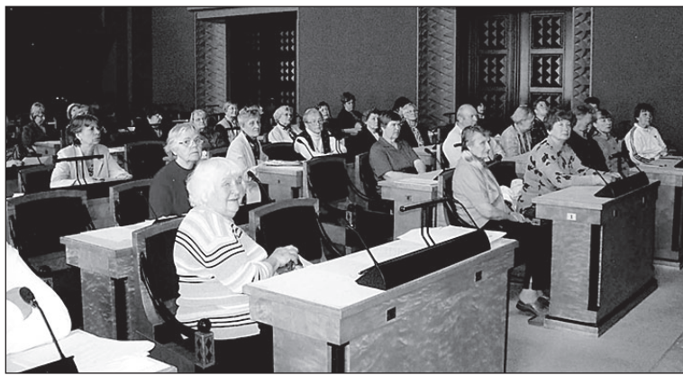
• Võimalus istuda Riigikogus.