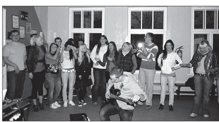
• Noortekeskuse aktiiv esineb Valgas.

✦Otsustati korraldada kirjalik enampakkumine Lilli koolimaja kinnistu võõrandamiseks alghinnaga 300 000 krooni ja korterimandi Remi