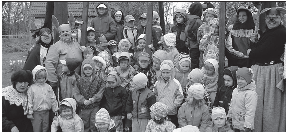
• Lasteaialapsed Murri häärberis

tab kultuuri- ja noorsootöö teenust. Pensionäridel on oma mittetulundusühing „Vääna Veenused“.