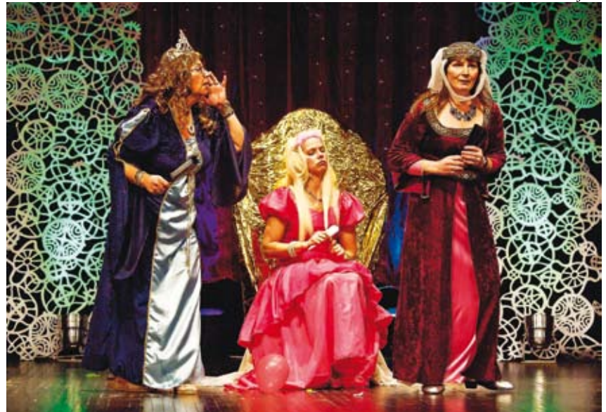
Etendus „Kolm kopikat“ paelus lapsi nii kostüümide kui sisu poolest.