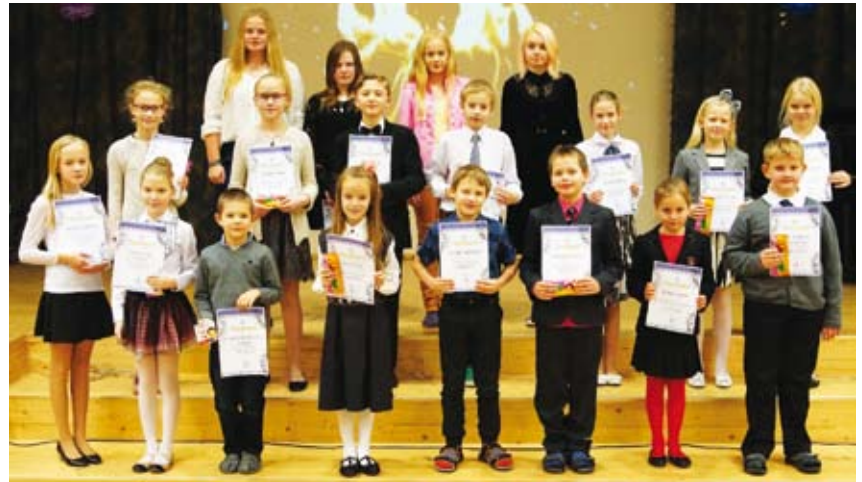
Kool tänab parimaid õpilasi.