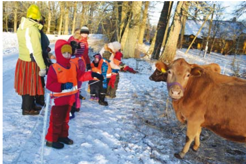
Muhklimaal loomi vaatamas.