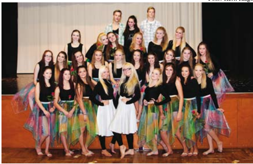
Tantsuetenduse „Valikute küüsis“ esietendus kultuurikeskuses.

Kahjuks on loo sisu kurb, paneb kõvasti mõtlema noorte probleemide üle, analüüsima, endasse vaatama ning loodetavasti ka märkama, kuidas saaks