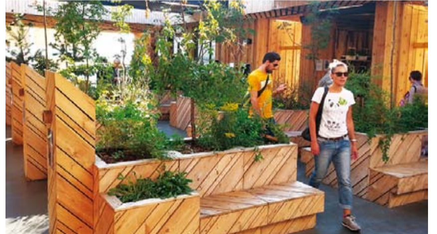
Eesti looduse väljapanek oli ideaalne paik loogastumiseks.