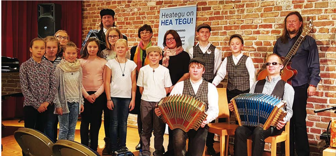
Esinejad muusika abil head tegemas.