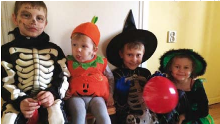
Halloweeni tunnuseks on kõrvits ja hirmuäratavate kostüümidega lapsed.

Ei maksa aastaid peljata, mis tuleb, see tulema peab. Kõik mööduv Sa julgelt seljata ning tuleviku toogu vaid head!