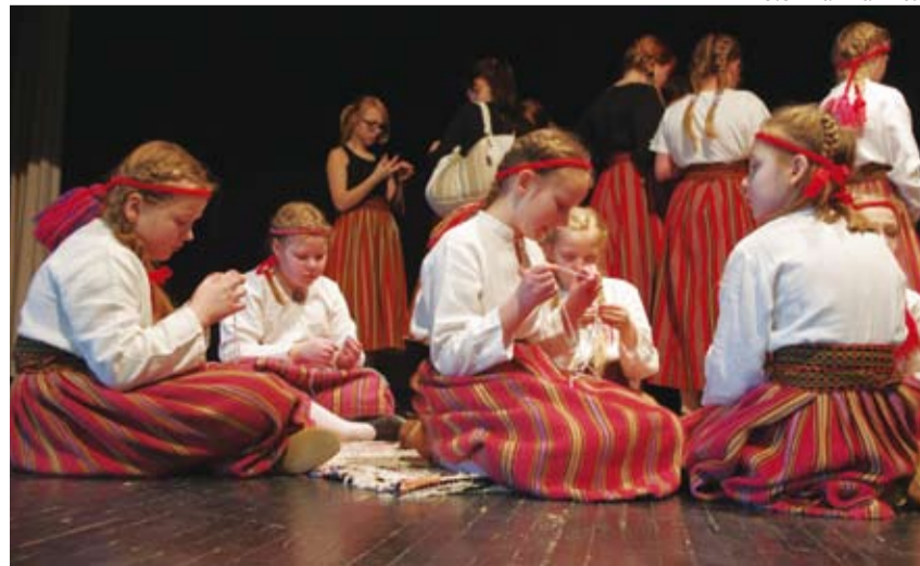
Iga laps sai näpunööri punuda ja endale käevõru meisterdada.