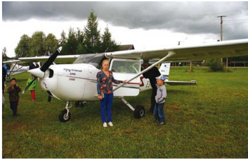
Karksi lennupäev on kogunud tuntust mitmete huvitavate ja sportlike vaba aja veetmise võimalustega.