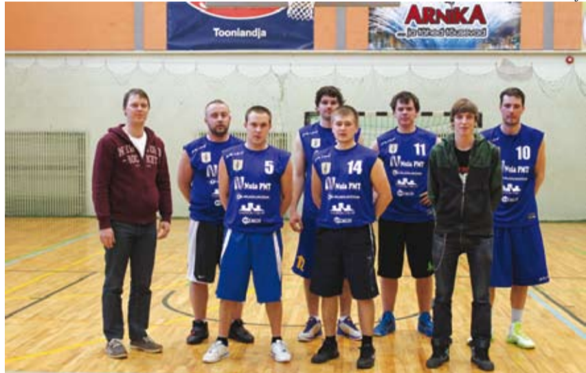
Karksi valla võistkond pärast viimast mängu.