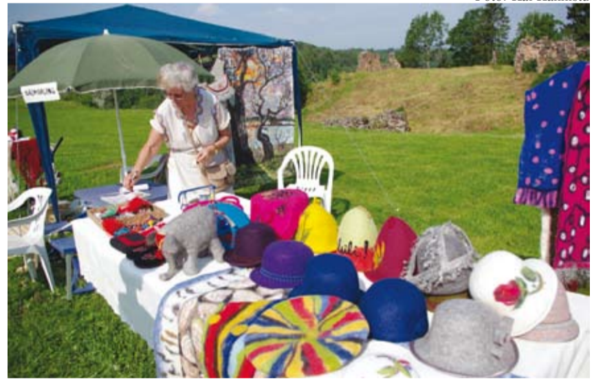
Kodukandipäevadel saab imetleda ja osta kaunist käsitööd, osaleda tegelustubades, nautida kodukandi ilu ja toredaid inimesi.