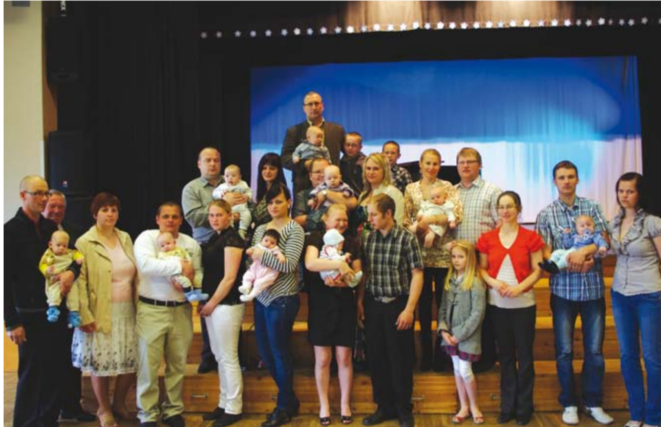
Väikesed vallakodanikud koos oma kõige kallimatega emadepäeva vastuvõtul.

2007. aastast alates on Karksi vallas saanud ilusaks traditsiooniks kinkida igale vastsündinud vallakodanikule hõbelusikas, millele on graveeritud valla vapp, lapse nimi ja sünnikuupäev. Lusikad antakse üle kahel korral aastas – emade- ja isadepäeval.