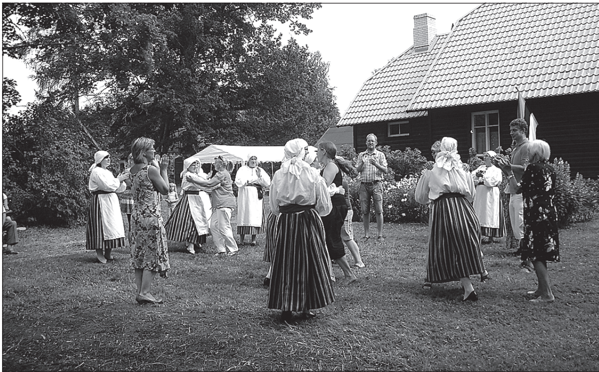
• Sudiste külapäev peeti Pisina talus.