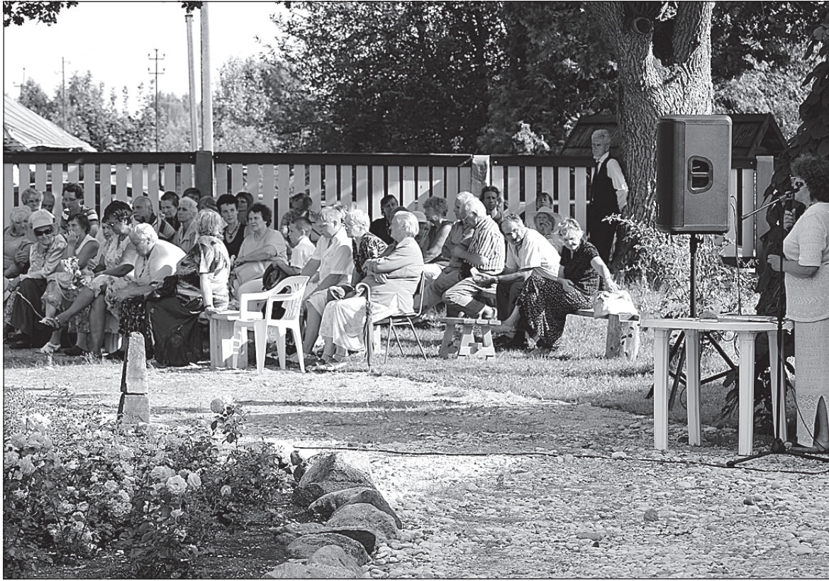
• Külapäevale oli tulnud palju rahvast.