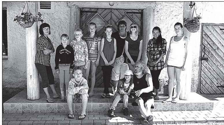
• Maalilaager Taageperas

XXIII Rahvusvahelise Folkloorifestivali „Baltica 2010“ ajal oli 180 väliskülalise hulgas ka liivlaste rühm Kandla Lätimaalt. Liivimaa külalisi võttis vastu Sudiste Maanaiste Selts. Esimesel päeval toimus Karksi kultuurikeskuses Sudijate folkloori-