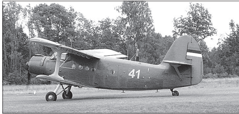
• Piirivalve lennusalga lennuk AN-2