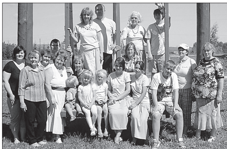
• Koos liivlastega Sudiste külakiigel