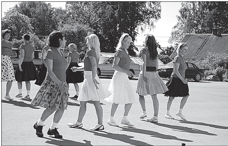
• Linetantsijad esinevad lastekaitsepäeval.