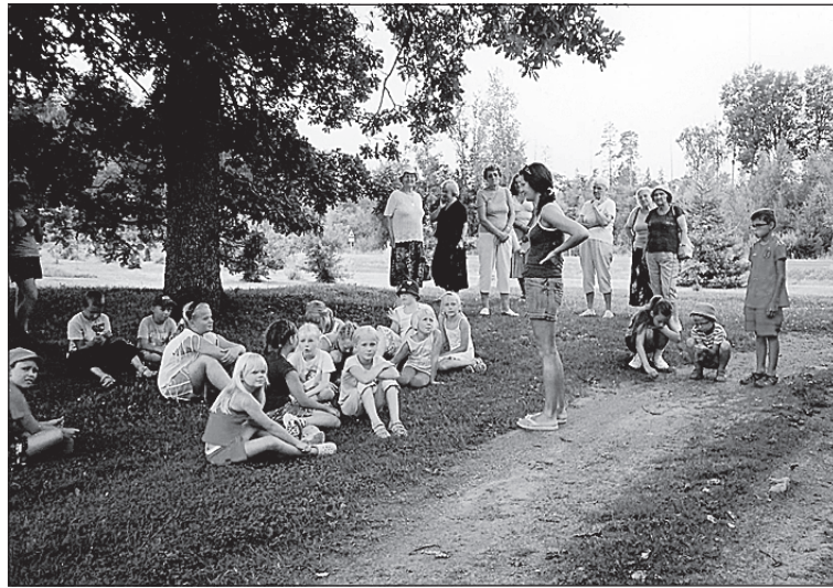
• Puhkehetk Heimtali koduloomuuseumi õuel

Heimtali koduloomuuseumis meeldis lastele kõige enam vana