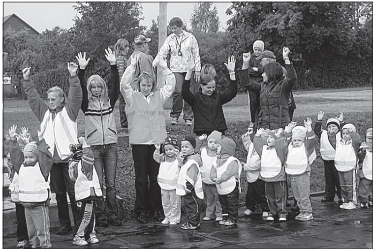
• Tibude ja Piilude rühm spordipäeval