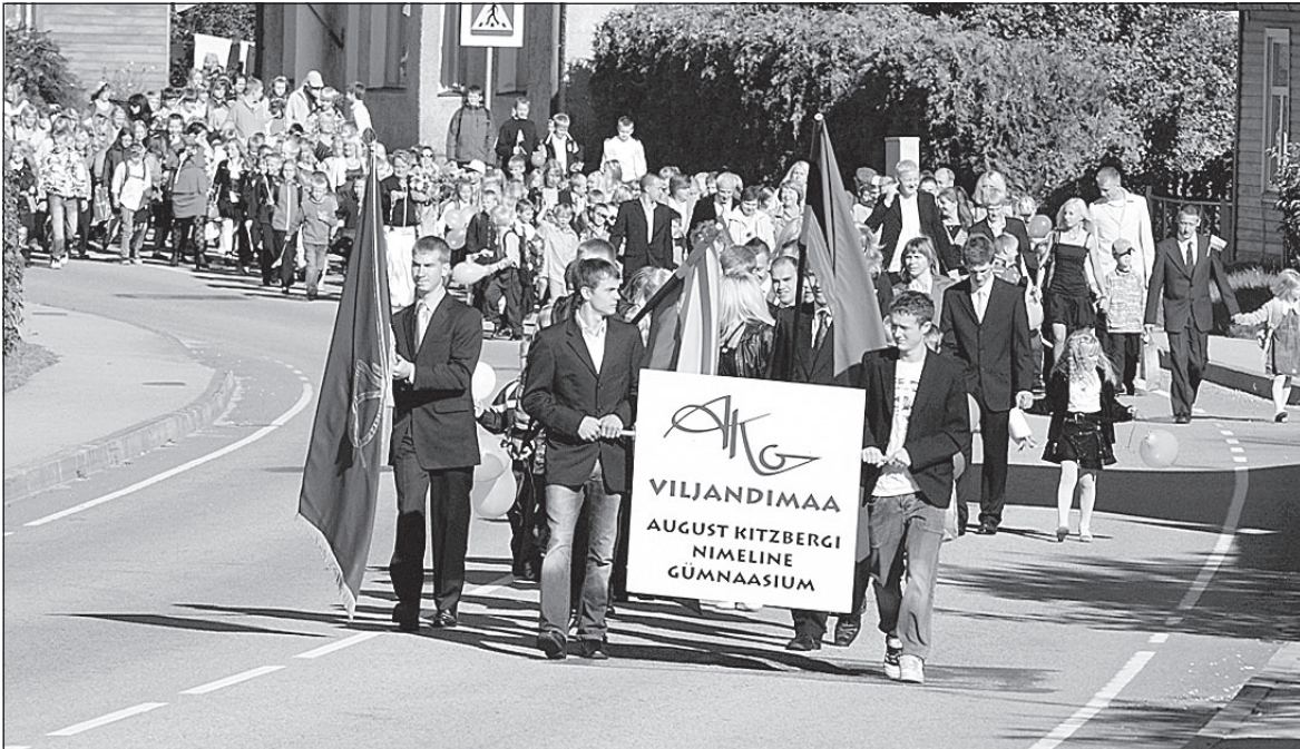
• Esimese koolipäeva rongkäik

• Karksi valla infoleht • Nr. 9 (177) Oktoober 2010 •