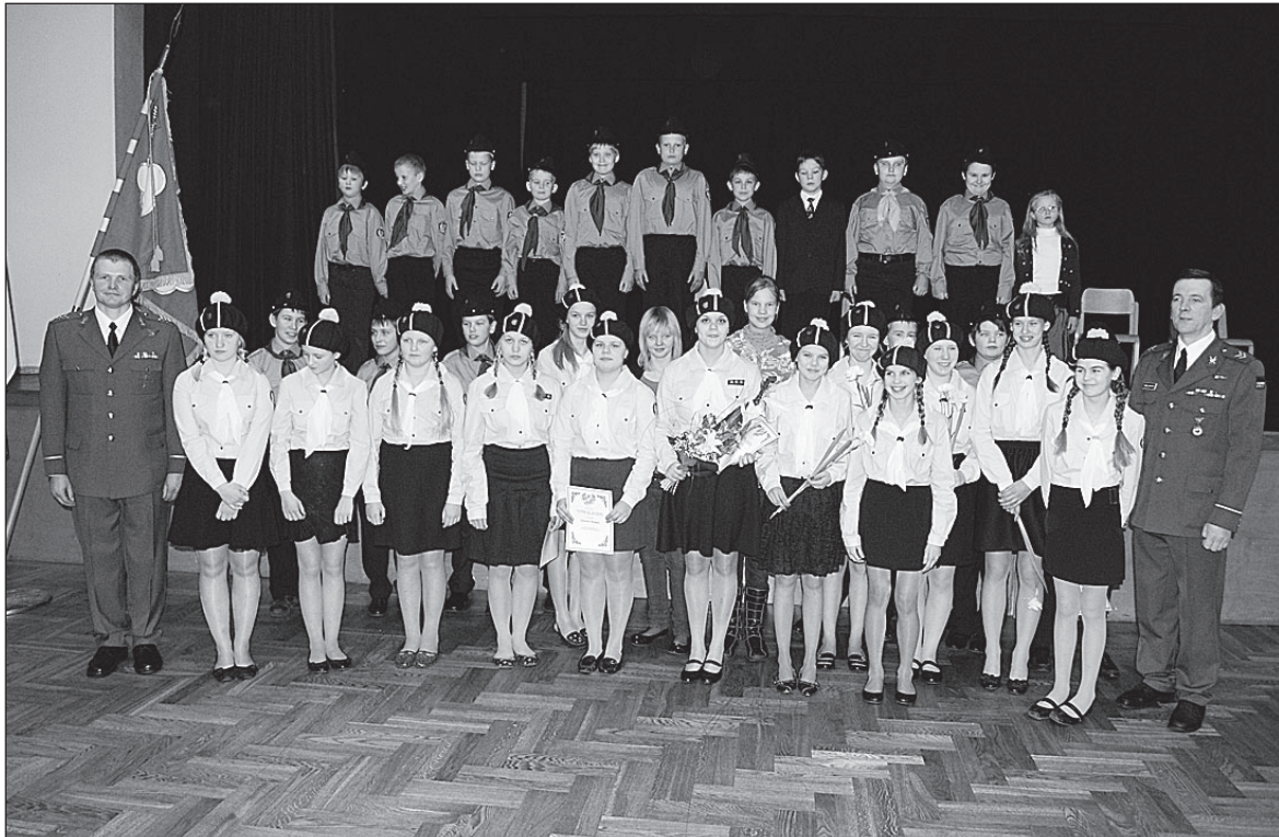
• Kodutütred ja noorkotkad