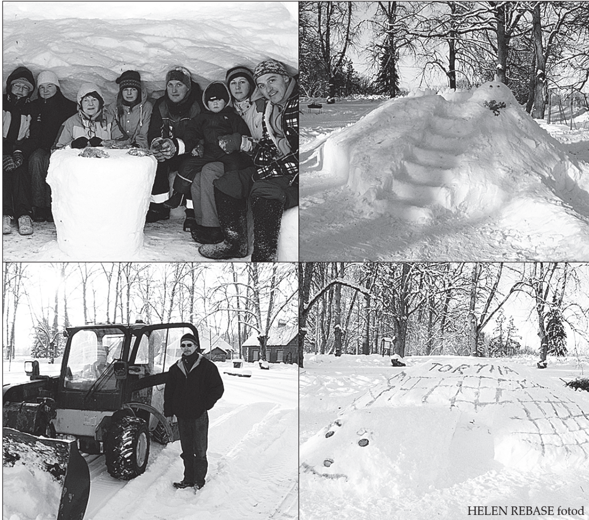
HELEN REBASE fotod